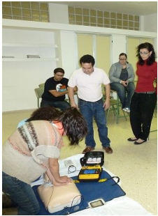
Prácticas con material de primer nivel